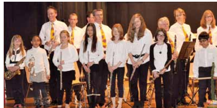
L'école de musique lors du concert du 23 mars à St-Aubin.