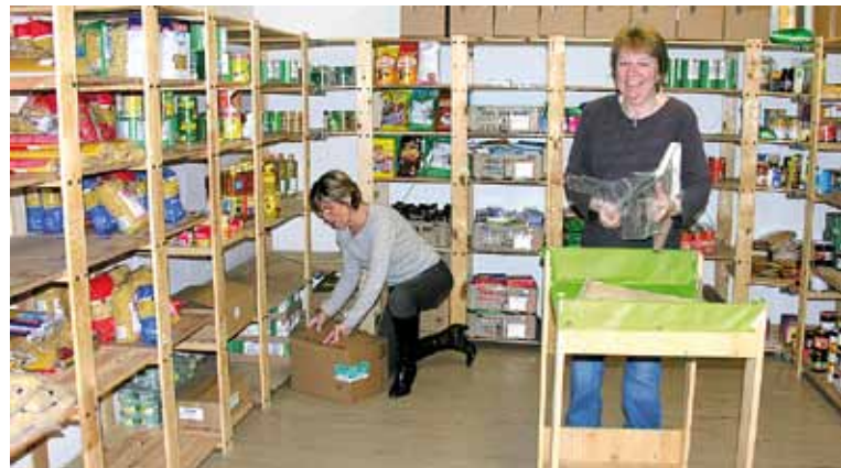
Bénévoles préparant les stocks dans le magasin de Perreux.

Edito Une récente étude économique d'UBS montre que dans notre canton il faudrait favoriser fiscalement les actifs entre 25 et 65 ans, plus que les familles comme cela a été fait récemment. Ne pensez-vous pas que beaucoup de neuchâtelois s'en sont rendus compte depuis longtemps, sauf nos élus! Avec plus 40 000 francs de dette par habitant, les élus de ce dimanche auront du « pain sur la planche »! A part cela, ne faut-il pas relever que l'UBS est meilleure pour analyser les difficultés de notre canton qu'elle l'était pour les siennes? BO